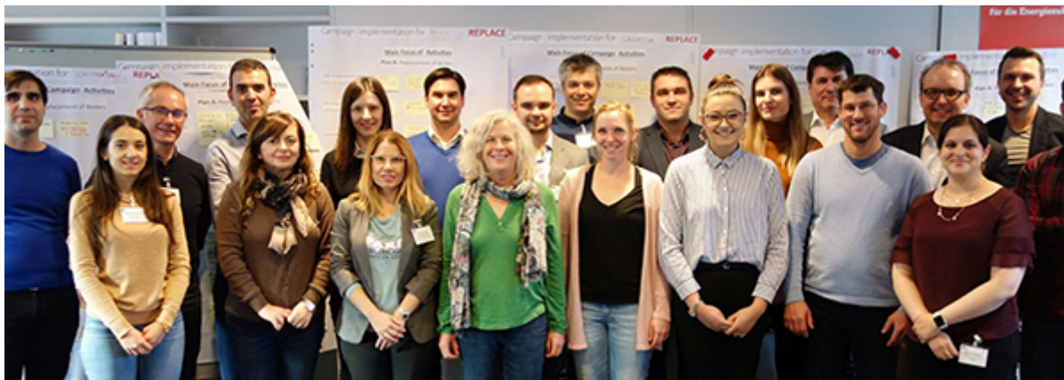
Тимот REPLACE на почетниот состанок во Виена, ноември 2019 година.