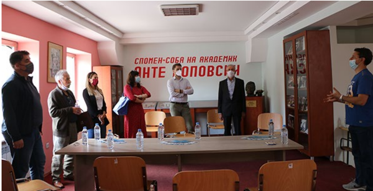
Официјално отворање на информативен центар во Скопје, Северна Македонија.

Семинари за обука: REPLACE спроведува семинари за обука за посредници и инвеститори за подобрување на нивните капацитети и пренесување на знаење од искусни на помалку искусни професионалци. Кликнете на линкот и дознајте повеќе за семинарите и како да добиете материјал за обука.